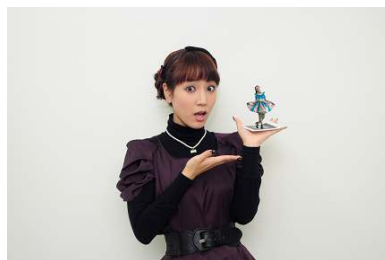
ARイメージ/モデル・池澤春菜