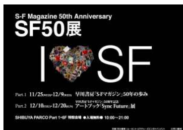
渋谷パルコ特別展ポスター