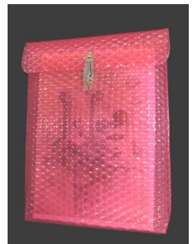
アートブック/通常版(左)・限定版(右)